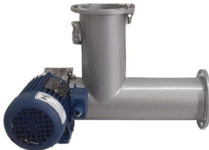
RG 2300 - Regulador de fluxo de grãos

O Regulador de Fluxo RG-2300 é uma solução simples e robusta para garantir um fluxo constante de material sobre o sensor, aumentando a precisão da medida de umidade